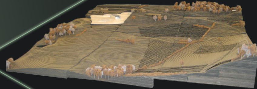
MAQUETTE DE RECHERCHE VOLUMIQUE DANS LE PAYSAGE